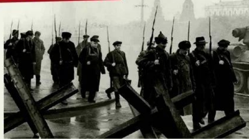
Вверху: московское ополчение на Красной площади. 1941 год.