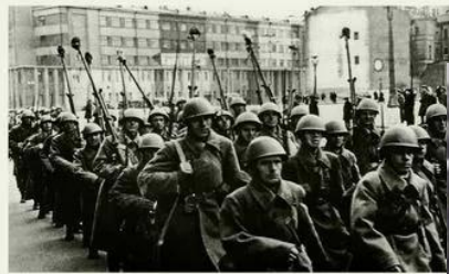
Слева: призыв. 1941 год.